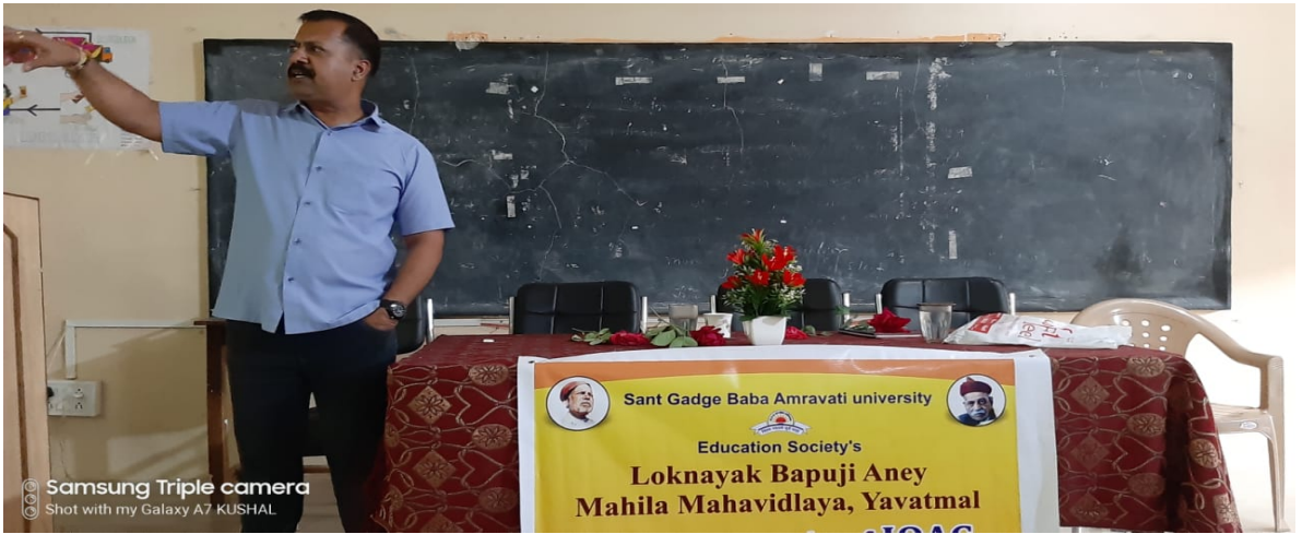
Samsung Triple camera Shot with my Galaxy A7 KUSHAL